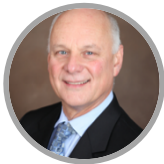
ចៅក្រម Tom Crabtree ប្រធានមន្ត្រីតុលាការ វិទ្យាស្ថានតុលាការជាតិ ប្រទេសកាណាដា

បេសកកម្មប្រចាំប្រទេសចិន ក្នុងឆ្នាំ២០១៣។ គាត់បានធ្វើការងារជាមួយទីភ្នាក់ងាររដ្ឋាភិបាលចិន រួមទាំងតុលាការកំពូល ស្តីពី ការកែលម្អច្បាប់ និងការអភិវឌ្ឍសមត្ថភាពនៅក្នុងលិខិតបទដ្ឋានគតិយុត្តិផ្នែកហិរញ្ញវត្ថុ , PPP , យុត្តិសាស្ត្របរិស្ថាន និងការប្រើប្រាស់បច្ចេកវិទ្យាដោយតុលាការ។ លោកស្រី Fiona ក៏ជាសន្ទានការី និងមជ្ឈត្តករផងដែរ។ បច្ចុប្បន្ន គាត់គឺជាប្រធានផ្នែកច្បាប់ ពាណិជ្ជកម្មនៃកម្មវិធីជំនួយបច្ចេកទេសតំបន់របស់ ADB: ការពង្រឹងសមត្ថភាពតុលាការឆ្ពោះទៅរកការអភិវឌ្ឍសេដ្ឋកិច្ចប្រកប ដោយចីរភាពនៅអាស៊ី និងប៉ាស៊ីហ្វិក។