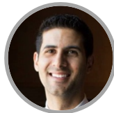
Jesse Mark មេធាវីផ្នែកអប់រំឌីជីថល វិទ្យាស្ថានតុលាការជាតិកាណាដា (NJI)

ក្នុងនាមជាគណៈវិនិច្ឆ័យប្រកបដោយជំនាញខ្ពស់ និងជាអ្នកគាំទ្រដ៏ខ្លាំងក្លាចំពោះការអភិវឌ្ឍវិជ្ជាជីវៈតុលាការ លោកចៅក្រម Crabtree បានចូលរួម NJI ក្នុងនាមជាប្រធានមន្ត្រីតុលាការ ក្រោយពីបានបម្រើការងារនៅក្នុងក្រុមប្រឹក្សាភិបាល ជាអ្នកតំណាង ក្រុមប្រឹក្សាប្រធានអង្គចៅក្រមនៃប្រទេសកាណាដា។ គាត់មានអាជីពក្នុងឱ្យកត់សម្គាល់នៅក្នុងអង្គចៅក្រម។ គាត់ត្រូវ បានតែងតាំងដំបូងឱ្យបម្រើការងារនៅឯតុលាការខេត្តនៃ British Columbia ក្នុងឆ្នាំ១៩៩៩ និងបានក្លាយជាប្រធានចៅក្រមក្នុងឆ្នាំ២០១០។ គាត់ត្រូវបានតែងតាំងឱ្យបម្រើការងារនៅឯតុលាការកំពូលនៃ British Columbia ក្នុងឆ្នាំ២០១៨។ នៅក្នុងអាជីពរបស់លោក ចៅក្រម Crabtree បានបង្ហាញឱ្យឃើញនូវចំណាប់អារម្មណ៍លើបញ្ហាជនជាតិដើមភាគតិច។ ខណៈពេលដែល ប្រធានចៅក្រមបម្រើការងារនៅ B.C. គាត់បានធ្វើការងារជាមួយសហគមន៍ជនជាតិដើមភាគតិច ដើម្បីអភិវឌ្ឍតុលាការកាត់ទោសថ្មីសម្រាប់ជនជាតិដើមភាគតិច ចំនួន៥ និងអភិក្រមថ្មីមួយ ដើម្បីដោះស្រាយករណីពាក់ព័ន្ធកុមារជនជាតិដើមភាគតិច ដែលកំពុងស្ថិតក្រោមការថែទាំ។ គាត់ក៏បានត្រួតត្រាយនូវការប្រើប្រាស់បច្ចេកវិទ្យា ដោយមិនត្រឹមតែធ្វើឱ្យការងារនៅឯតុលាការរបស់លោកកាន់តែមានតម្លាភាព បង្កលក្ខណៈងាយស្រួល និងមានប្រសិទ្ធភាពខ្ពស់ប៉ុណ្ណោះទេ ប៉ុន្តែក៏មានការចូលរួម ជាមួយសាធារណជនផងដែរ។ ចៅក្រម Crabtree បានរួមចំណែកចំពោះការផ្តួចផ្តើមជាច្រើនពាក់ព័ន្ធនឹងការអប់រំតុលាការ នៅប្រទេសកាណាដា និងនៅក្រៅប្រទេស។ គាត់ក៏មានភាពសកម្មផងដែរនៅក្នុងគណៈកម្មាធិការអប់រំតុលាការ ក្នុងនាមជា សមាជិកនៃគណៈកម្មាធិការរៀបចំផែនការតុលាការ សម្រាប់កម្មវិធីជាតិជាច្រើនរបស់ NJI និងបានផ្តល់តម្លៃដល់សមាជិកមហាវិទ្យាល័យ។